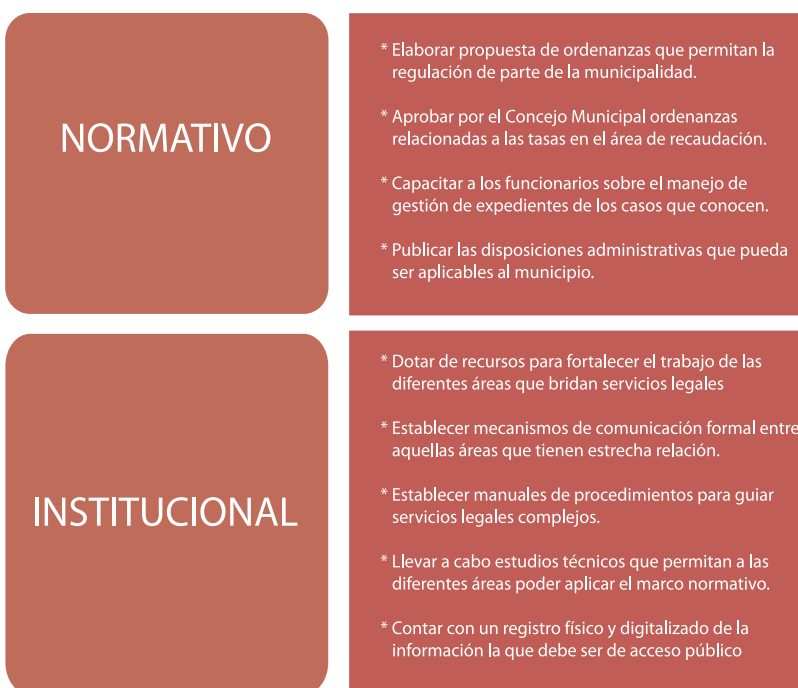
Diagrama 4: Recomendaciones del proceso

En algunas áreas de la municipalidad se requiere realizar con urgencia estudios técnicos que permitan sentar las bases para la elaboración de ordenanzas que permitirían el cobro de impuestos. Por ejemplo, elaboración de mapas de zonificación, de avalúos catastrales y censo de los negocios para mejorar la recaudación del Impuesto de Bienes Inmuebles (IBI), el Impuesto Municipal sobre Ingresos (IMI) y el Impuesto por Matrículas y Licencias (IML).