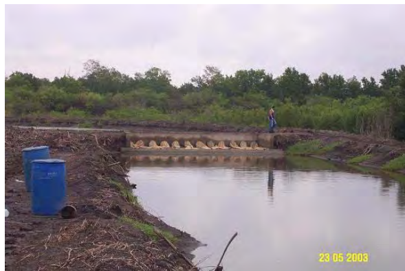
Reservorios o canales de entrada de agua.