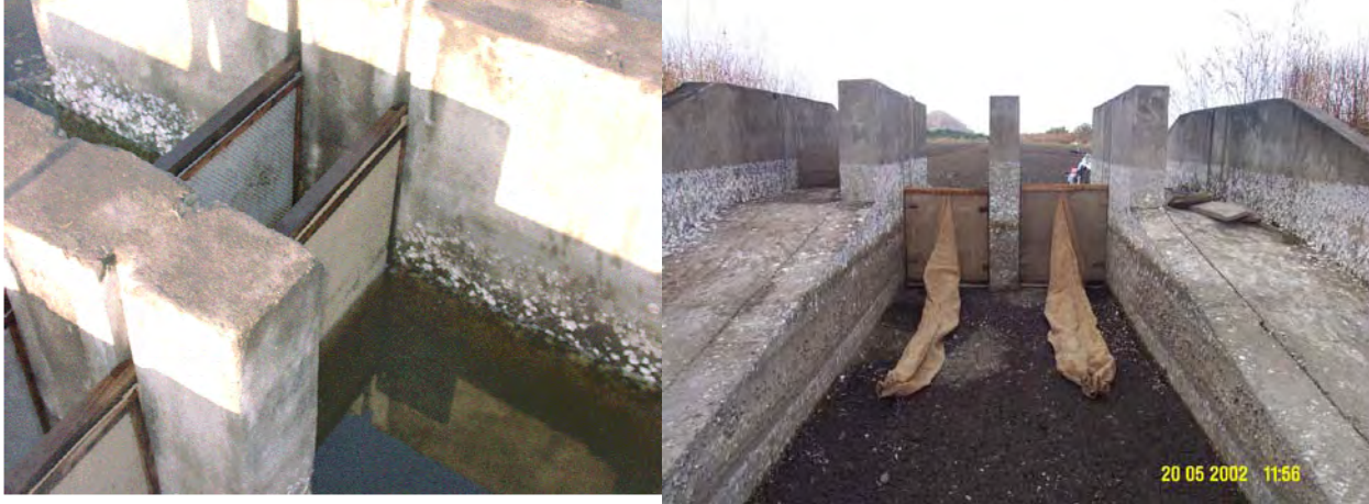
Filtros usados en una camaronera en las compuertas