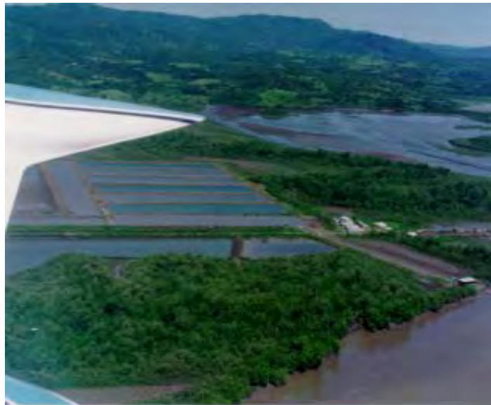
Foto aérea de una granja camaronera, Estero Real, Nicaragua.