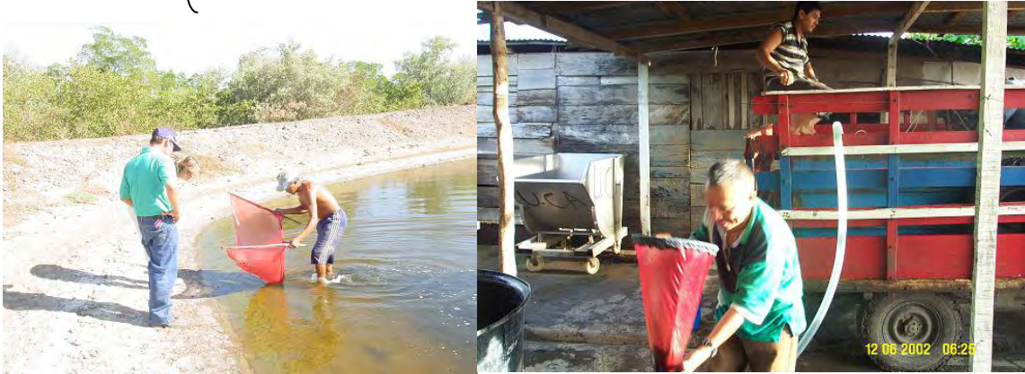
Las BPM desalientan el uso de Larva silvestre.