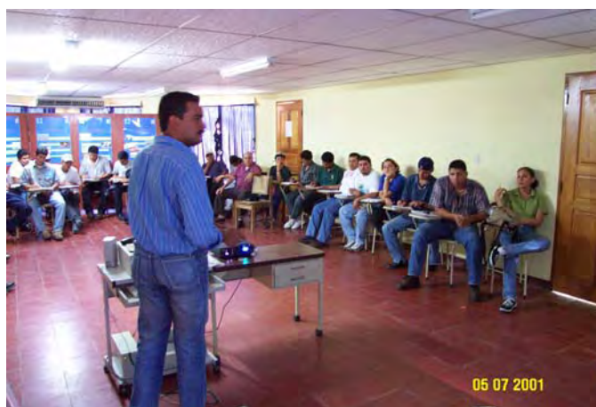
Asamblea de Productores de Camarón.