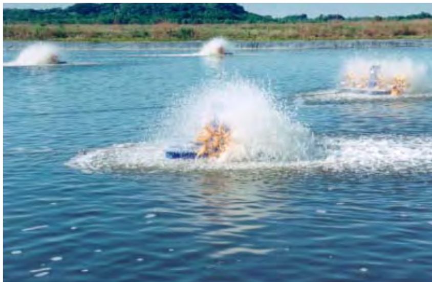
Aireadores de Paleta comunes en sistemas de cultivo intensivo de camarón