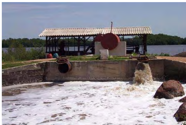
Estación de bombeo de una granja camaronera.