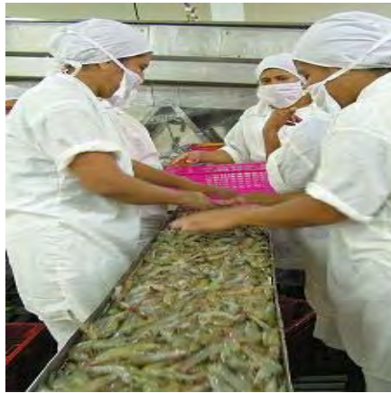
BPM durante la cosecha de camarones.