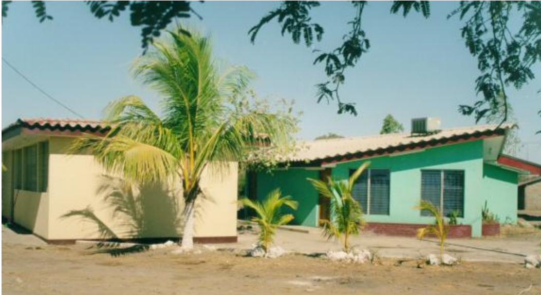
Figura No.12. Infraestructura de la UCA en Puerto Morazán

Es un trampolín porque permite traer la ayuda directamente a las familias más pobres y dar un apoyo muy eficaz. Las personas que trabajan a diario en la UCA en Puerto Morazán son un gran pilar para la asociación porque están inmersos en el campo. Esto asegura una repartición de la ayuda de la mejor manera posible.