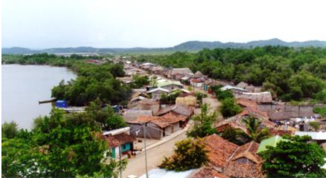
Figura No.15. Vista de Puerto Morazán desde lo alto

Puerto Morazán recibe, entonces, con frecuencia varias ayudas extranjeras. Desde la implantación de esta fundación la situación en el pueblo cambió y mejoró. Aunque los resultados de esta ayuda no están visibles a escala individual eso permitió mejorar mucho las condiciones de vida para la comunidad. Los efectos son más comunes y menos individuales, pero eso trae un progreso muy grande para la población entera.