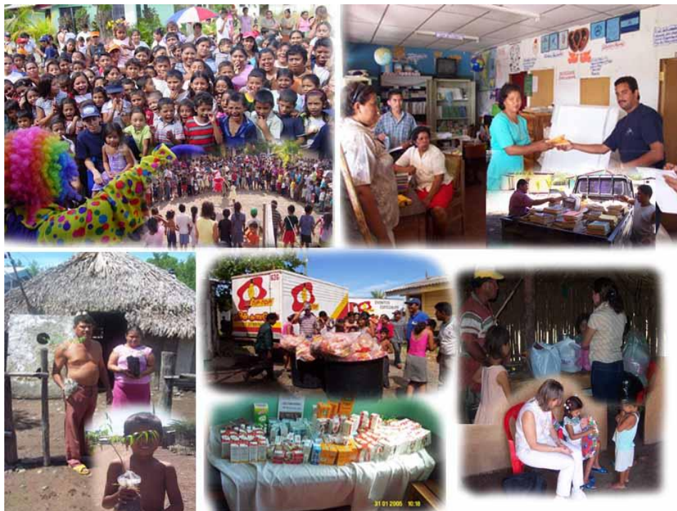
Figura No.13. Actividades que frecuentemente se realizan con la población de Puerto Morazán