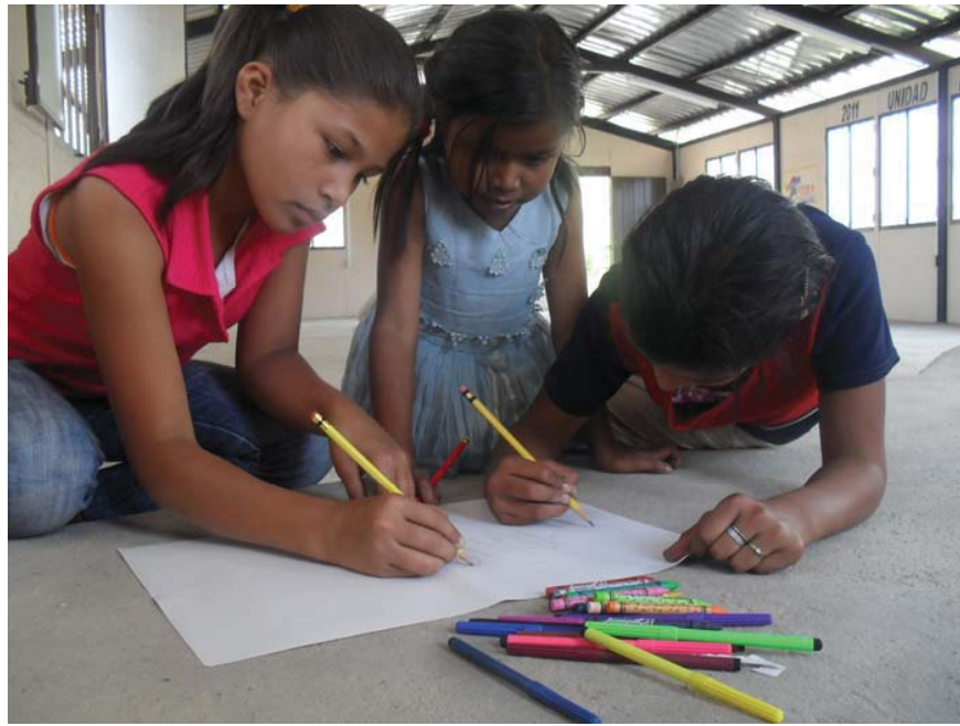
Niñas dibujando como sueñan su comunidad