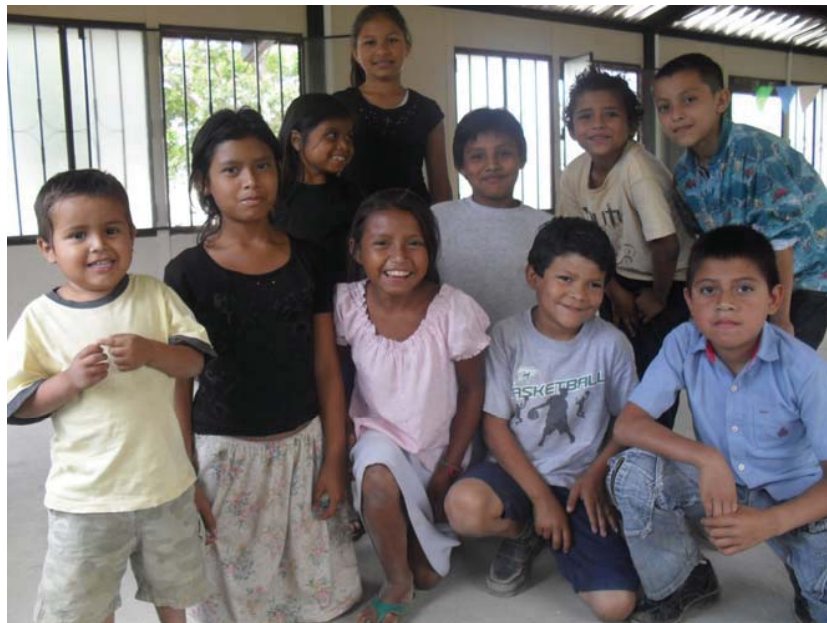
Niñas y niños de la comunidad de Yucul, entre ellos/as nuestros entrevistados/as.