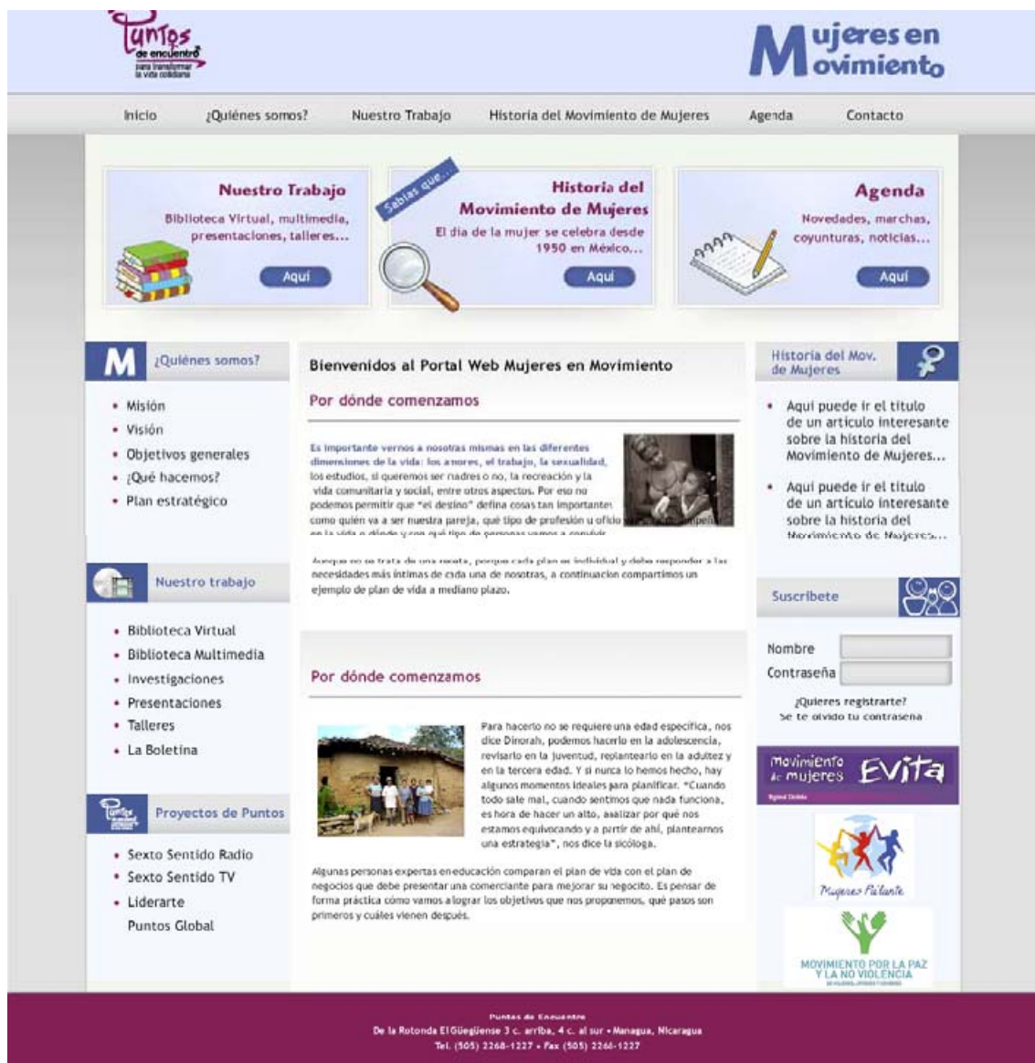
Figura 2. Página de inicio del sitio de Mujeres en Movimiento

Cuando se tenía una idea sobre la estructura se comenzó el diseño del sitio. Esta propuesta es elaborada en Photoshop para mostrar la página de inicio del sitio y definir y aprobar los colores, orden de la información, sistemas de navegación, la ubicación del contenido y las imágenes, todo esto con la finalidad de darle forma a la propuesta tomando en cuenta el tipo de audiencia que buscábamos y el análisis anterior. La primera propuesta se analizó entre la diseñadora y mi persona, le realizamos cambios hasta llegar a un concepto visual que nos pareciera atractivo y que se pudiese presentarse a la Dirección. Esta es la primera propuesta con información preliminar, en base a la estructura aprobada.